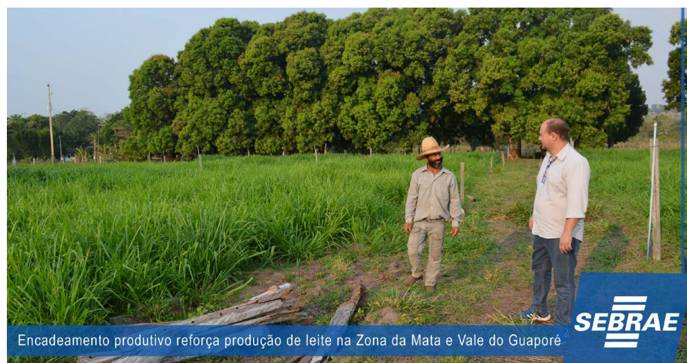
Encadeamento produtivo reforça produção de leite na Zona da Mata e Vale do Guaporé