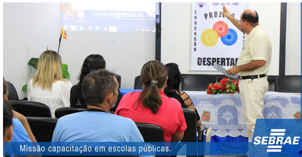
Missão capacitação em escolas públicas.