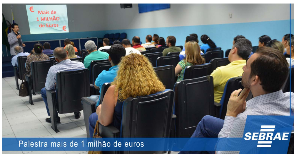
Palestra mais de 1 milhão de euros