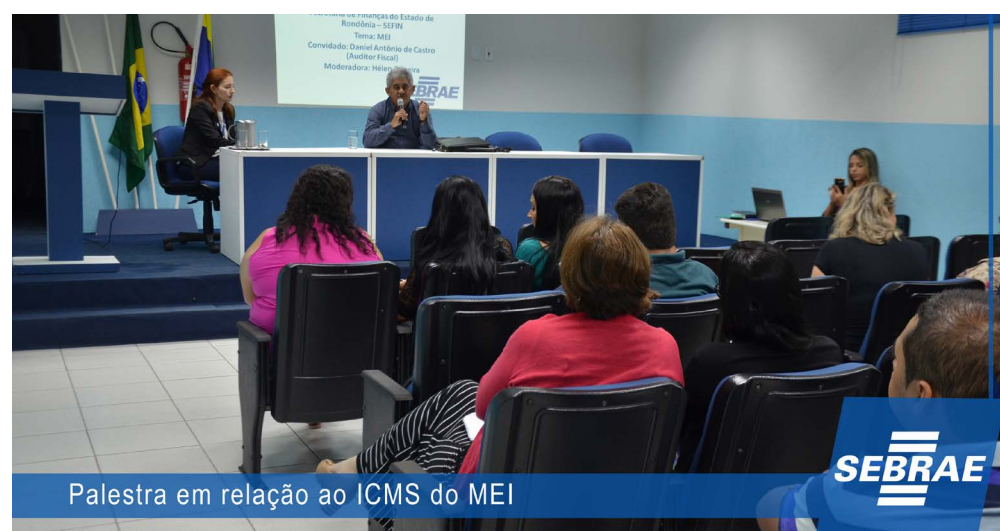
Palestra em relação ao ICMS do MEI