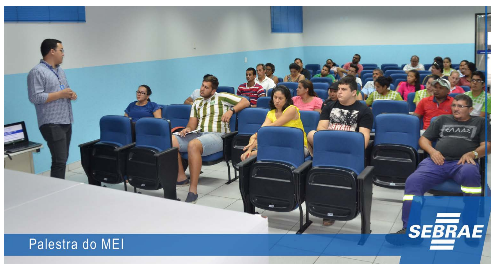
Palestra do MEI